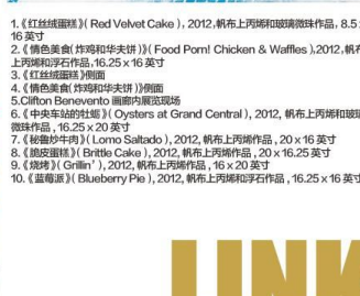
1. 《红丝绒蛋糕》(Red Velvet Cake), 2012, 帆布上丙烯和玻璃鳞片作品, 8.5 x 16 英寸 2. 《棕色美食 炸鸡和华夫饼》(Food Porn! Chicken & Waffles), 2012, 帆布上丙烯和浮石作品, 16.25 x 16 英寸 3. 《红丝绒蛋糕》侧面 4. 《棕色美食 炸鸡和华夫饼》侧面 5. Clifton Benevento 画廊内展览现场 6. 《中央车站的牡蛎》(Oysters at Grand Central), 2012, 帆布上丙烯和玻璃鳞片作品, 16.25 x 20 英寸 7. 《秘制炒牛肉》(Lomo Saltado), 2012, 帆布上丙烯作品, 20 x 16 英寸 8. 《脆皮蛋糕》(Brittle Cake), 2012, 帆布上丙烯作品, 20 x 16.25 英寸 9. 《炸鸡》(Grill), 2012, 帆布上丙烯作品, 16 x 20 英寸 10. 《蓝莓派》(Blueberry Pie), 2012, 帆布上丙烯和浮石作品, 16.25 x 16 英寸